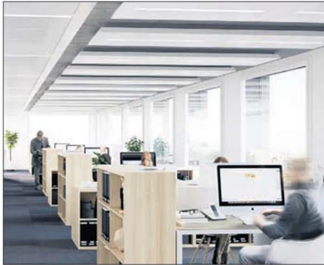
Espace et lumière pour ces futurs bureaux.

Des bureaux ultra-modernes et lumineux occuperont les sept premiers niveaux de la Tour «Lyon 77», déclinés en vastes plateaux (660 m 2 env. du 1 er au 5 e étage; 350 m 2 env. aux 6 e et 7 e étages). Ces surfaces sont modulables au gré des preneurs, leur totalité pouvant être louée par une seule et même enseigne. Le prix de location des surfaces inclut un équipement de base