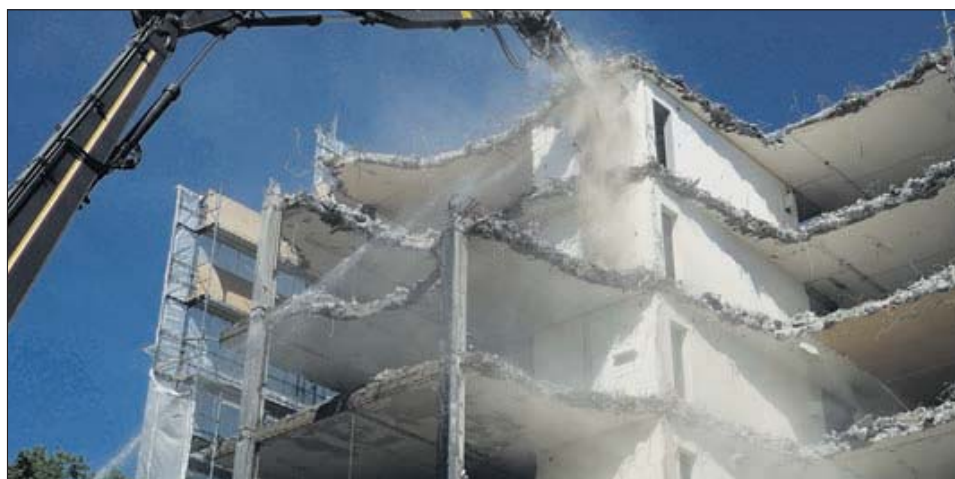
Une démolition «propre en ordre»...

L'ancienne tour des Charmilles a progressivement disparu au fil des semaines, littéralement croquée par les machines. A sa place se dressera une tour à l'allure contemporaine: du haut de ses 14 étages, soit 49 mètres, «Lyon 77» sera le point culminant du quartier. Les 4000 m 2 de surfaces de bureaux et les 500 m 2 d'arcades sont maintenant ouverts à la location.